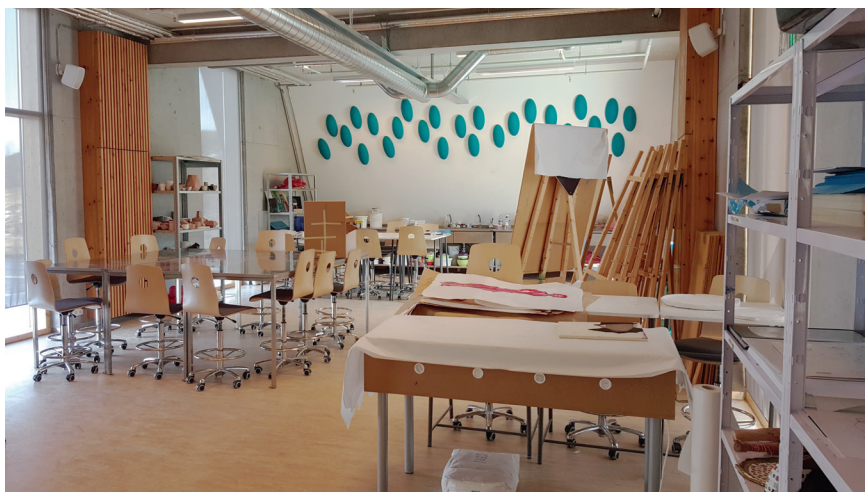
Kunstverksted ved Framhaldsskólinn í Mossfellsbæ.

Den nåværende læreplanen har endret lærere og studenters tilnærming til undervisningen. En rekke nye begreper og fokusområder har blitt implementert, og det tar tid å integrere dette i skolehverdagen. Noe av det som er nytt er innføringen av seks bærende søyler. Disse gjennomfører hele læreplanen og er som følger: 1) skriftkyndighet (litteracy), 2) bærekraft, 3) helse og velferd, 4) demokrati og menneskerettigheter, 5) likestilling og 6) kreativitet. Disse områdene skal være integrert i alle fag i hele skoleløpet. I tillegg er det beskrevet fem nøkkelkompetanser: 1) uttrykk og kommunikasjon, 2) kreativ og kritisk