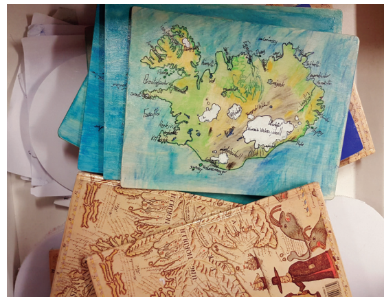
Elever på 4. trinn ved Fossvogsskóli har tegnet og malt kart. Treplaten skal sages i mange biter slik at det blir et puslespill.