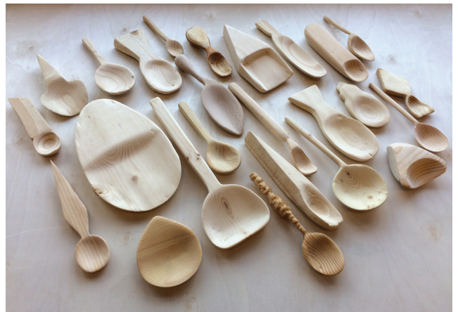
7. trinn på Skjønnhaug skole har laget skeier i tre. Et av målene under hovedområdet design i LK06 er at elevene skal kunne lage enkle bruksformer i ulike materialer og kunne gjøre rede for sammenhengen mellom idé, valg av materialer, håndverksteknikker, form, farge og funksjon.

Det siste året er det fra flere hold pekt på at håndverket må styrkes skolen. Grunnen til dette er først og fremst den lave rekrutteringen til yrkesfagene i videregående skole og den store mangelen på fagarbeidere. For å styrke håndverksdimensjonen foreslo kunnskapsminister Torbjørn Røe Isaksen (Høyre), i fjor høst, å utrede om kunst- og håndverksfaget skal deles i to fag på ungdomstrinnet; til et kunstoffag og et håndverksfag og la elevene velge ett av dem. Et samlet fagmiljø har vært imot deling av faget. Blant annet har det blitt pekt på at en deling vil kunne føre til kjønnssegregering ved at jenter velger kunst og gutter velger håndverk, og at grunnskolen ikke lenger er allmenndannende om elevene må velge ett av fagene. Vi i Kunst og design i skolen (KDS) har først og fremst argumentert for at styrken ligger i at kunst og håndverk er samlet i ett fag. KDS er bekymret for at elementene som ivaretar det kreative og innovative fra både