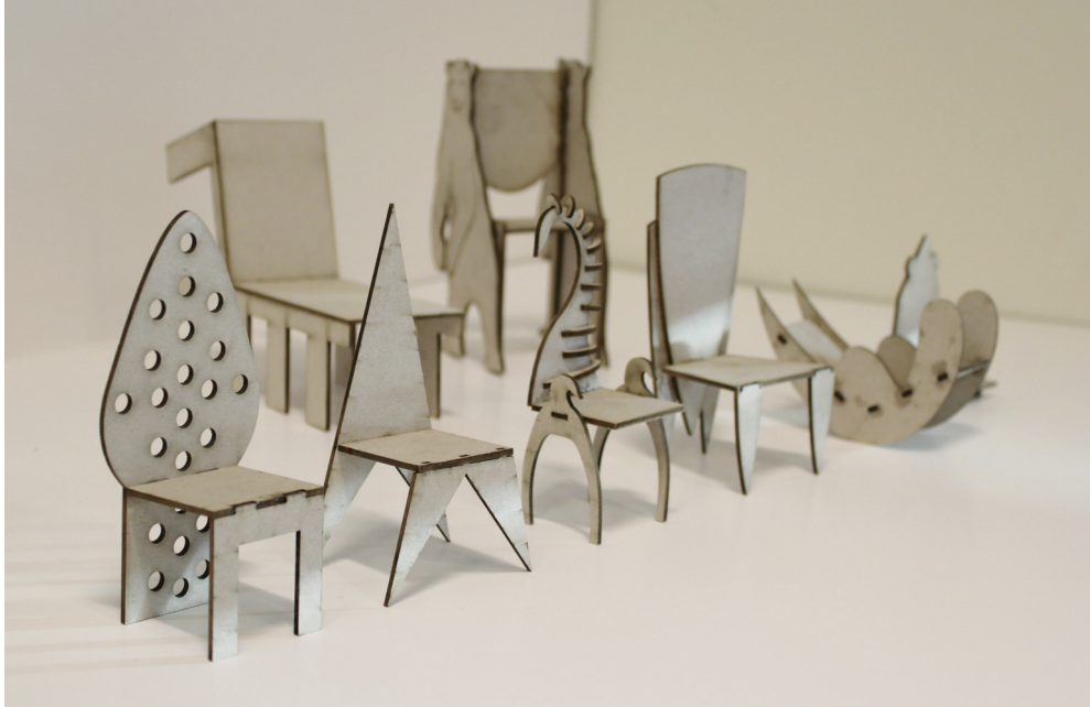
Elever på Vg2 interiør og utstillingsdesign ved Vågen videregående skole har designet stoler. Elevene tegnet stolene i Illustrator og printet ut prototyper ved hjelp av laserkutter. Stolene var senere del av en større utstilling. I oppgaven ble arbeidstegning, målestokk og design vektlagt.

I arbeidet med revideringen av LK06 er det satt ned læreplangrupper i alle fag. Gruppenes første oppgave er å definere fagenes kjerneelementer som skal gjennomsyre læreplanen til de enkelte fagene. Kunst og design i skolen foreslår tre kjerneelementer for faget kunst og håndverk; håndverk, tegning og visuelle virkemidler. Vi mener at disse elementene utfyller hverandre og er beskrivende for fagets egenverdi. Praktisk skapende arbeid står sentralt i faget, og praktisk innsikt er en forutsetning for å kunne virke som profesjonsutøver, være kvalitetsbevisst, ta kloke valg som forbruker, og mestre vedlikehold og reparasjon. Tegning er et sentralt kommunikasjonsmiddel i faget. Å kunne tegne setter oss i stand til å visualisere det som enda ikke finnes, til å synliggjøre det som skal lages eller vise hvordan noe virker eller er satt sammen, og er et viktig redskap i alle problemløsningsprosesser. Å kunne bruke visuelle virkemidler er sentralt i utviklingen av et hvilket som helst produkt. Det er også viktig å beherske det visuelle språket for å kunne lese og tolke visuelle representasjoner og avsløre visuell retorikk.