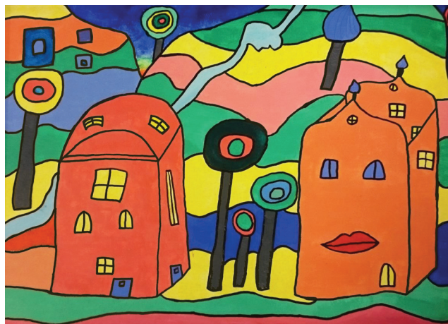
8. trinn på Geilo barne- og ungdomsskole har malt bilder inspirert av kunstneren og arkitekten Hundertwasser og arbeidet ut ifra hans filosofi om «ingen rette linjer». Motivet ble malt på treplater med akrylmaling og tusjpenne ble brukt til konturer.

De utfordringene vi i dag står ovenfor handler først og fremst om rammevilkår og lærerkompetanse i grunnskolen. Det er ingen formelle krav til lærerkompetanse for de som underviser i kunst og håndverk på 1.-7. trinn. På 8.-10. trinn er kravet 30 studiepoeng. 44 prosent av de som underviser i kunst og håndverk i grunnskolen (1.-10. trinn) har ingen faglig fordypning (SSB, 2014). Dette mener vi er katastrofalt. Vi ser også at stadig flere ikke har delte klasser (maks 15 elever) i kunst og håndverk og at verksteder nedlegges. Selvsagt finnes det også eksempler på det motsatte. Om faget prioriteres eller ikke kommer i stor grad an på den enkelte skoleleders holdning til faget. KDS mener at dette er svært uheldig og vi arbeider for at det skal settes krav til formell lærerkompetanse fra 1. trinn, samt at det gis nasjonale føringer for verksteder og gruppestørrelse.